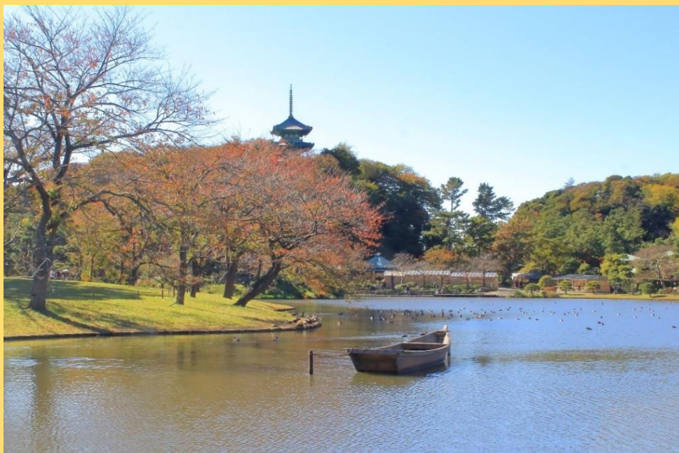
初秋の三溪園