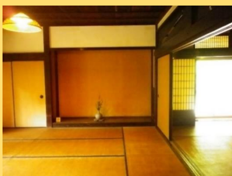
旧矢筈原家住宅 室内