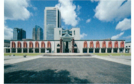
アイ・ウェイウェイ（艾未未） 《安全な通行》2016年 《Reframe》2016年 「ヨコハマトリエンナーレ 2017」展示風景（横浜美術館）