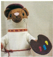
栄区 いたち川マスコット タッチーくん