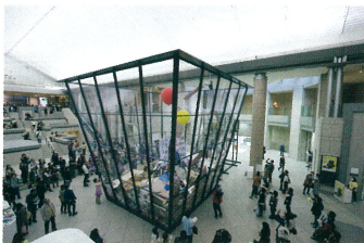
マイケル・ランディ 《アート・ビン》2010/2014年 「ヨコハマトリエンナーレ 2014」展示風景